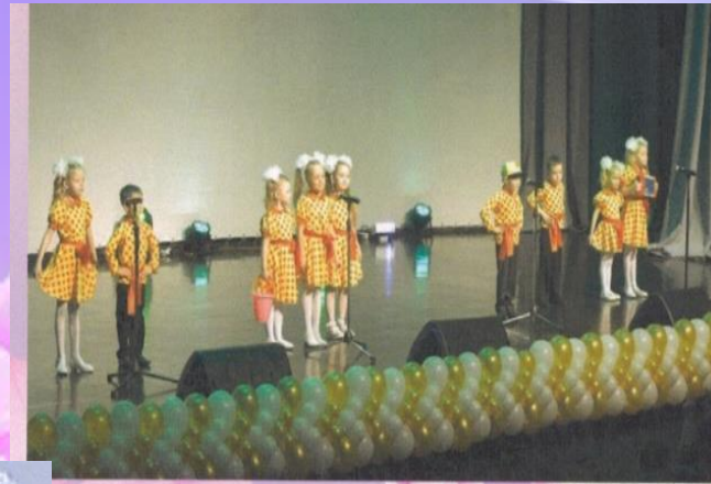
Вокальный ансамбль «РУЧЕЕК» Песня «АНТОШКА»