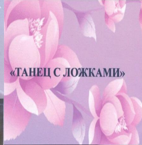
«ТАНЕЦ С ЛОЖКАМИ»